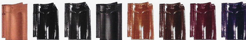
Naturröd Kolsvart Glaserad Blanksvart Glaserad Mattsvart Glaserad Ljusbrun Glaserad Mörkbrun Glaserad Vinnröd Glaserad Lila Glaserad