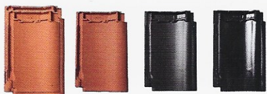
Naturröd Engoberad Naturröd Obehandlad Antracit Engoberad Djupsvart Glaserad